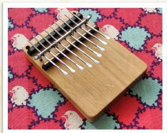
創作カリンバ工房オリジナルカリンバ 「オトモ」