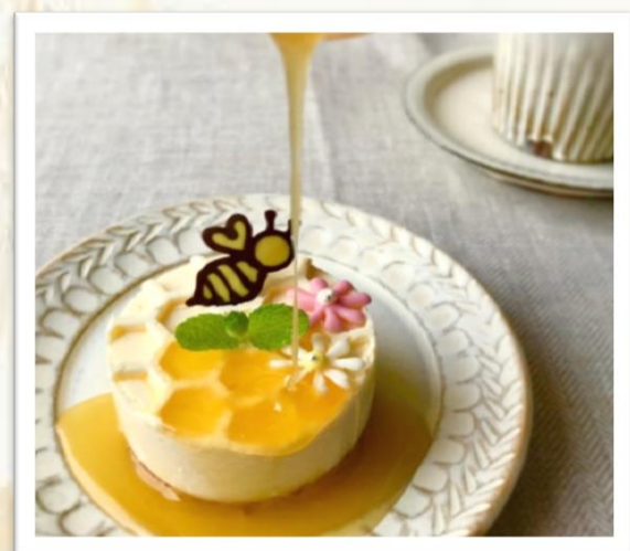
Cafe こもれび 贅沢はちみつチーズケーキ