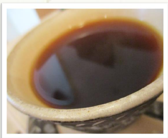
「自家焙煎 珈琲まめ坊」さんの こもれびブレンド